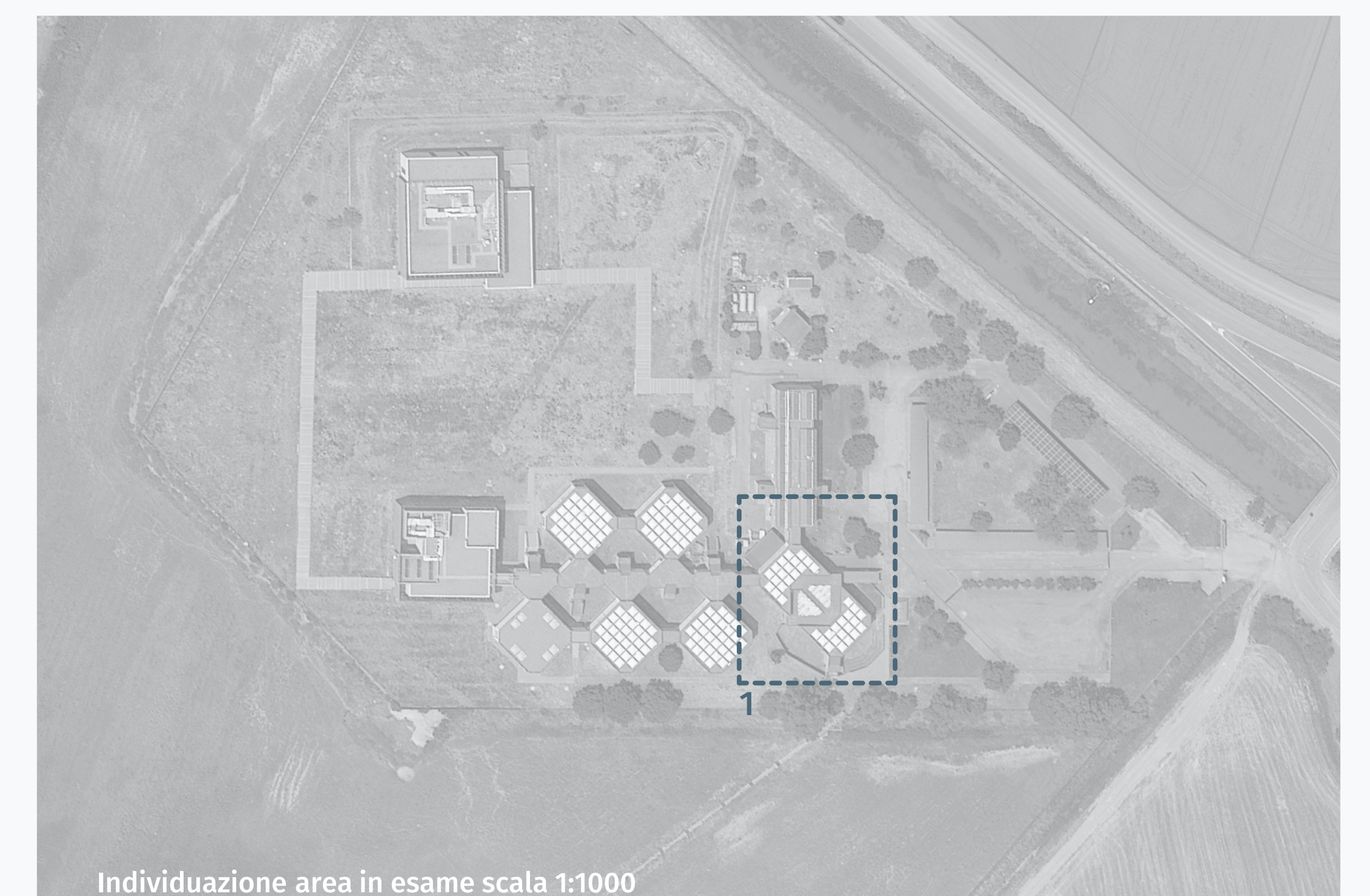
Individuazione area in esame scala 1:1000